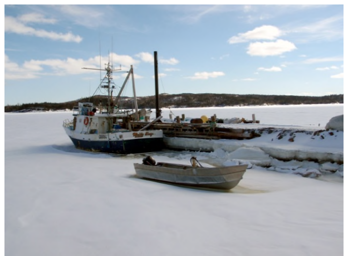
Mynd 3. Bátar sem notaðir eru við kræklingaræktunina frosnir inn í ís í einni höfninni á Notre Dame Bay á Nýfundnalandi.

Kræklingur hrygnir á tímabilinu maí til október, en júní til ágúst er aðalhrygningartímabil kræklings á