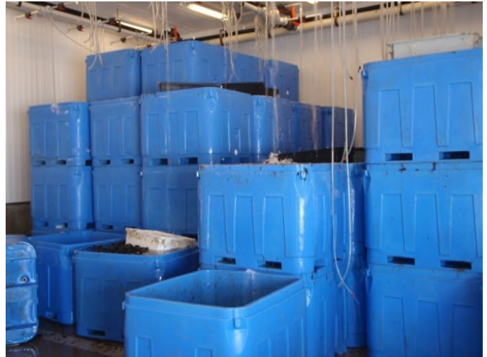
Mynd 4. Kræklingur geymdur lifandi í körum í pökkunarstöð á Nýfundnalandi.

Á Nýfundnalandi hefur þróunin verið frábrugðin því